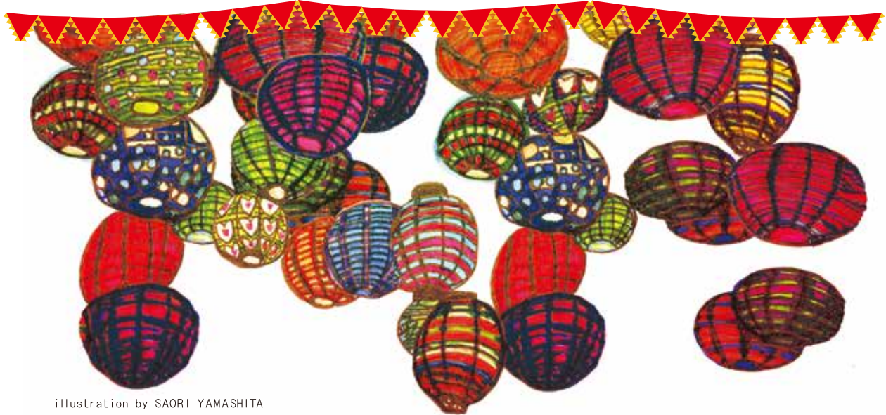
illustration by SAORI YAMASHITA

毎年冬の風物詩となっている長崎ランタンフェスティバル。新地中華街の人たちが旧暦の正月（春節）を祝う行事として始まりました。新暦は地球が太陽の周りを回る周期を一年の基準としていますが旧暦は月の満ち欠けを基準としており、明治五年まで採用されてきました。太陽の周期を基準とする新暦より一年が短く、三年で一ヶ月のずれが生じるため、三年に一度「十三月」を設けて調整していたそうです。