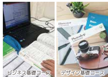
ビジネス基礎コース