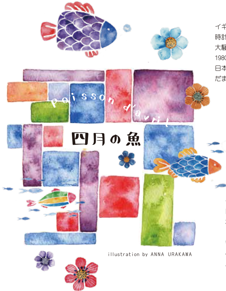
illustration by ANNA URAKAWA

イギリスBBCが、ロンドンのシンボルである国会議事堂の時計台ビッグベンが老朽化につきデジタル化されると発表し大騒ぎになったことがありました。