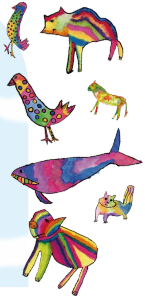
illustration by KANO TANEURA