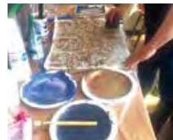
作品展に向けて制作中!

先月も触れていた通り、8月はミナトマチファクトリーの作品展がアルカスで開催されます。今回はなるべく多くのスタッフに展示会を意識してもらうため、大きな作品をみんなで制作しました。非常に迫力のある作品となっているので、ぜひ生で見たいと思っています。