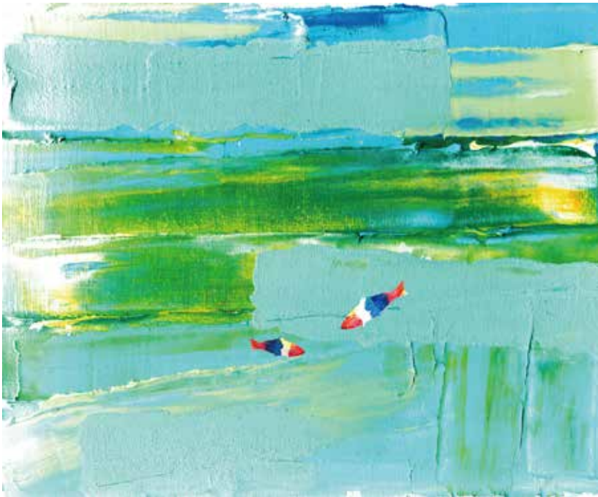
illustration by TAISUKE MAEDA

〒857-0871 佐世保市本島町 4-26 ライナービル 4F Tel:0956-23-7565 Fax:0956-59-8865 Mail:hotlife.sasebo@gmail.com