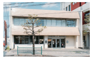
「やえたね」様となり