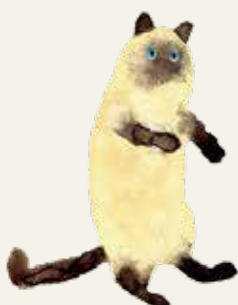
illustration by Anna Urakawa / Taisuke Maeda / Saori Yamashita