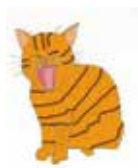
Illustration by Megumi Morishita

一人ひとりの個性と ライフスタイルを尊重した 働き方が見つかるよう お手伝いをしています。