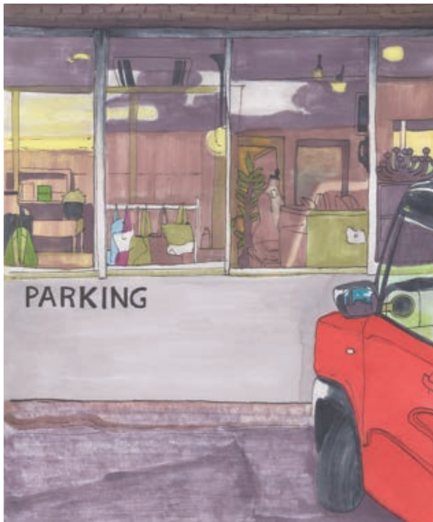
挿絵：西岡 芽巳さん