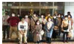
▲みなさん、いい笑顔♪ 和気あいあいとランチを堪能中!