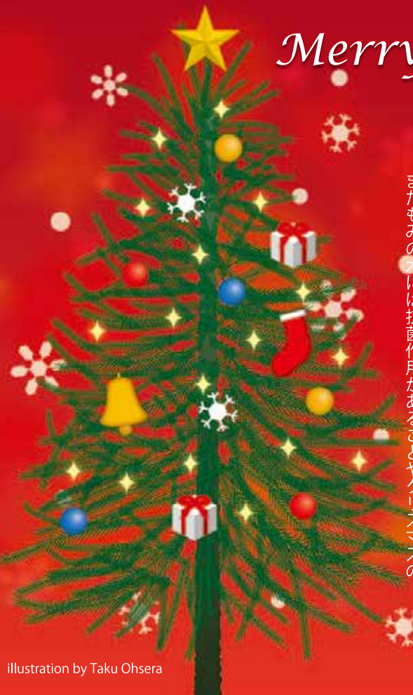
illustration by Taku Ohsera

クリスマスツリーの起源は諸説ありますが、北ヨーロッパに住んでいたゲルマン民族の冬至のお祭りから始まったのではないかとされています。 クリスマスツリーで使用されるもみの木は常緑樹で冬でも青々と葉を茂らせており、その生命力は厳しい冬を過ごさなくてはならない人々にとって豊かな生命力を感じさせる存在だったでしょう。 実際に、もみの木の学名はアビエス(abies)、ラテン語で「永遠の命」を意味しています。 またもみの木には抗菌作用があることやクリスマス木の