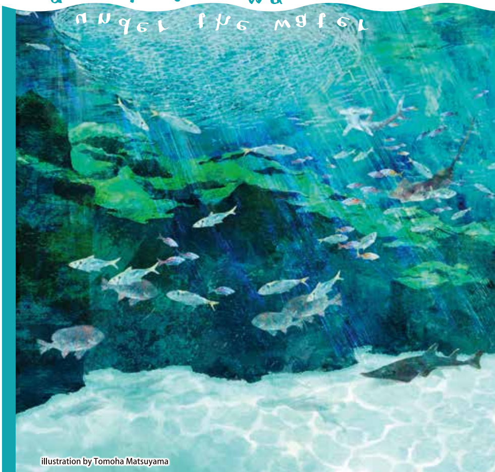
illustration by Tomoha Matsuyama

1882年(明治15年)、上野動物園の一角に観魚室(うのをぞぎ)と呼ばれる水槽が設置されました。淡水の魚展示施設で、これが日本で最初の公共の水族館とされています。