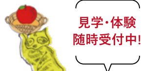
illustration by Kenji Yamasaki

それぞれの個性や特性にあった仕事や働き方を見つけていきます。 通所日や利用時間は自分の体調に合わせて無理なく設定できるので安心です。