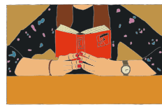
illustration : Megumi