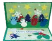
ワークショップでの 手作りポップアップカード