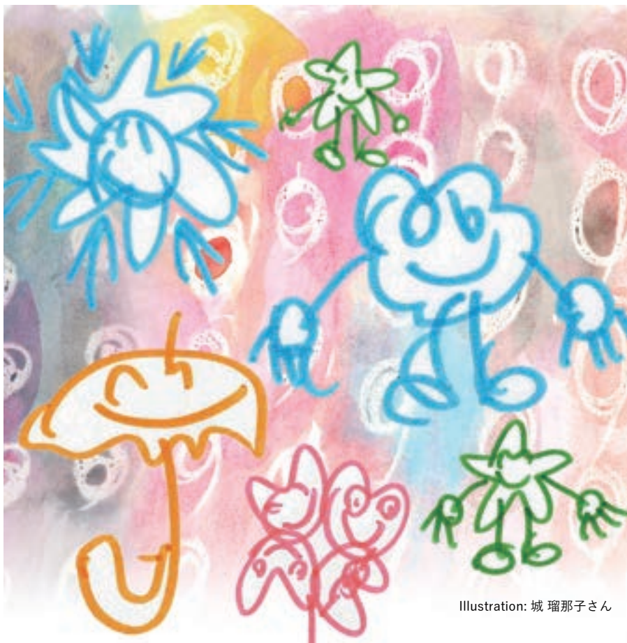
Illustration: 城 瑠那子さん

働く準備をする場所 / 雑貨づくりから働く喜びを / 「やりがい」が生まれるシステム