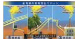
写真は「雷のふしぎ」について学習したものの一部です。想像を超える威力にみなさん驚いていました。