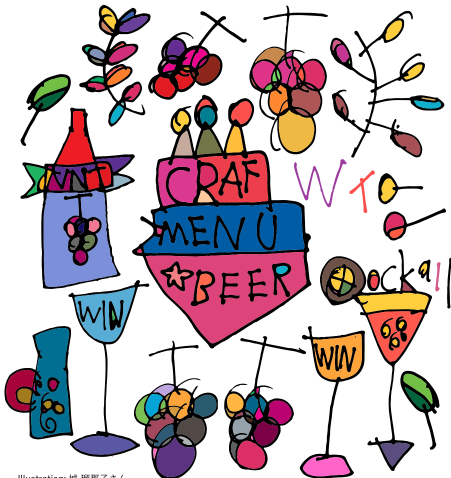
Illustration: 城 瑠那子さん

働く準備をする場所 / 雑貨づくりから働く喜びを / 「やりがい」が生まれるシステム