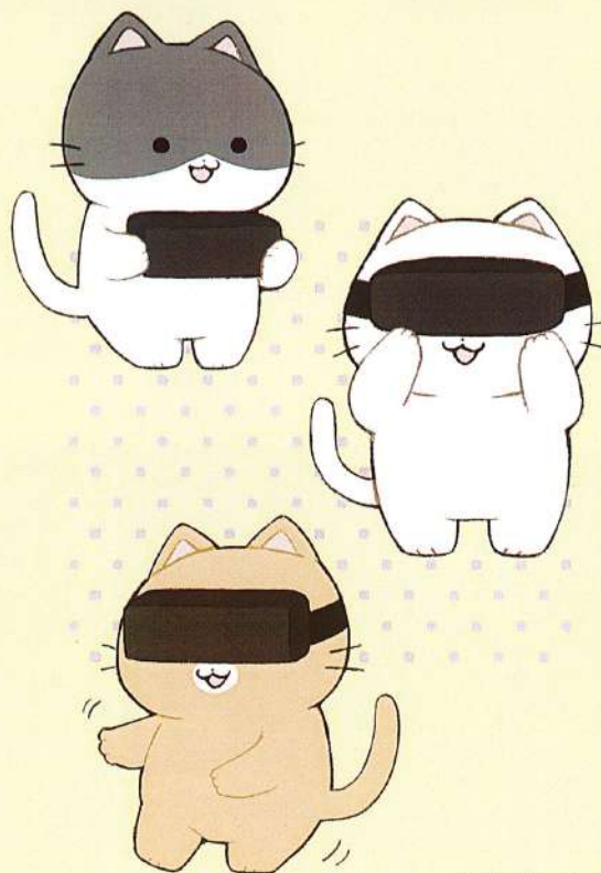
Illustration by いちのせ