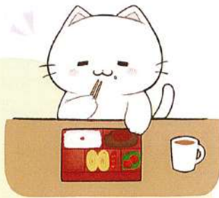
Illustration by いちのせ

みなさんからの要望にお応えして、L villageでの食事提供がスタートしました。補助が出ることで、実質本人負担金額は100円（普通・大盛の場合は200円）と、お手頃価格でご提供しております。日替わりのお弁当をご用意しており、時期によって旬を感じることもできます。健康的でおいしい食事を是非。