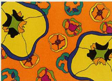
パブリカとピーマンの違いとは /トハ